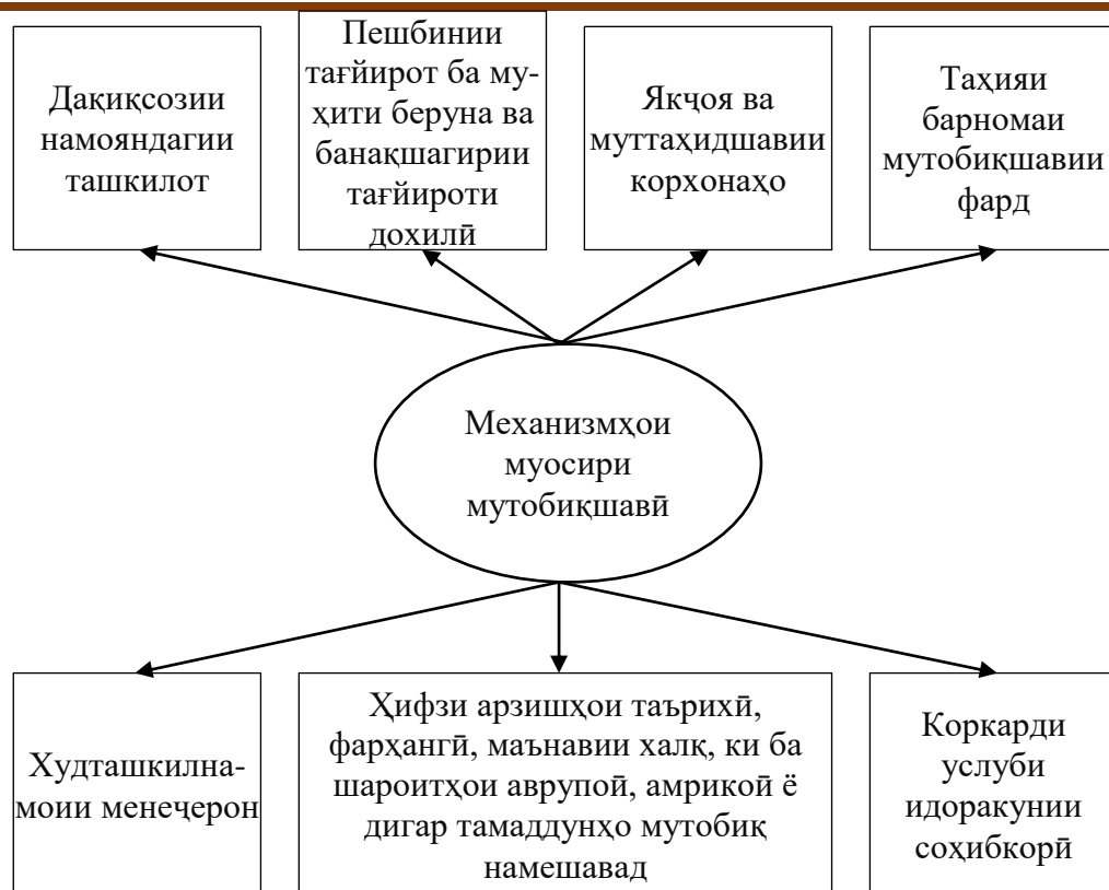
Расми 2 – Механизмҳои муосири мутобиқшавии корхонаҳои сохтмонӣ.

Дар ин самт муқаррар намудани идоракунии рақобатпазирии корхонаи сохтмонӣ аз ҳолати рақобатии он вобаста аст. Ин тариқи механизми рақобатнокии истифодашаванда барои рушди дарозмуддати корхона ба даст омада метавонад.